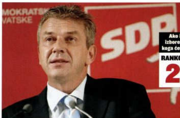
ŠANSA "Moja se šansa otvara čim počnu izravna sučeljavanja"

obratno, bio pobjednik ili poraženi, doslovce svi procjenjuju da mora skončati u ortaštvu s HDZ-om, kako bi obranio opseg svoga privatnog vlasništva. ➤➤